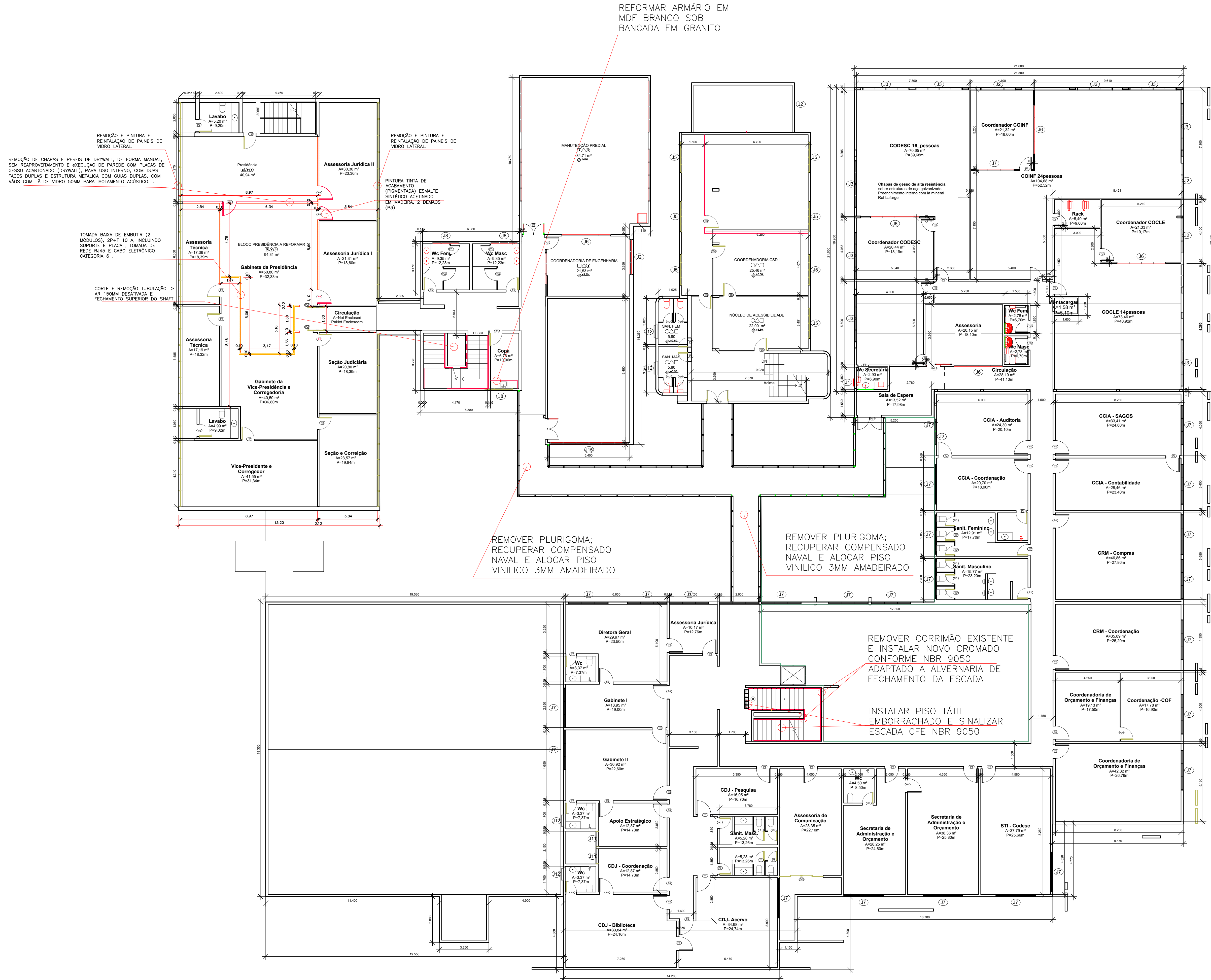
PLANYTA BAIXA - CONSTRUIR E DEMOLIR PAV. SUPERIOR - esc 1:125