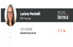
image001.png 34 KB