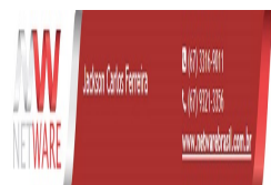
jackson-ferreira.jpg 16 KB