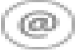
image014.png 909 B