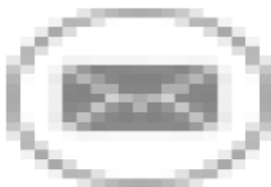
image003.png 903 B