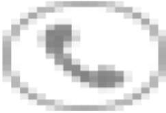
image002.png 849 B