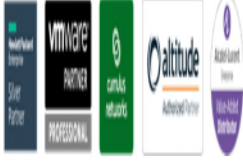
image015.png 20 KB