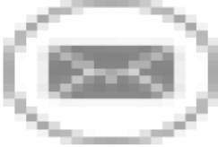
image013.png 906 B