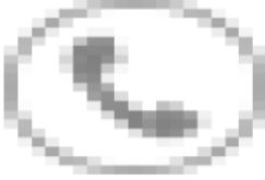
image012.png 849 B