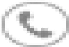
image002.png 849 B