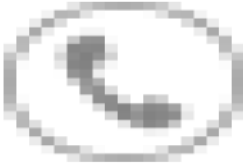
image012.png 849 B