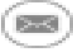
image003.png 903 B