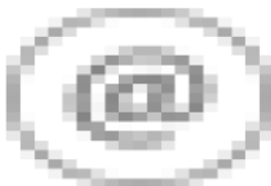
image004.png 906 B