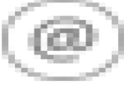
image014.png 909 B