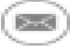
image013.png 906 B