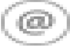
image004.png 906 B