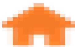
image015.png 609 B