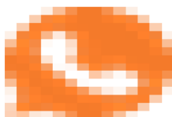
image013.png 747 B