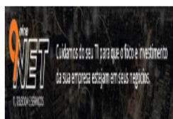
image011.jpg 15 KB

Seção de Licitação e Compras SAF/CRM/SLC - TRE/MS Fone: (67) 2107-7095