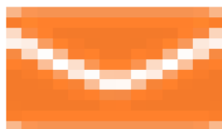
image014.png 570 B